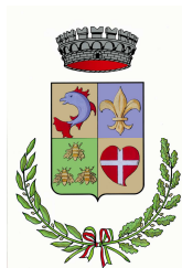
Comune di Pragelato